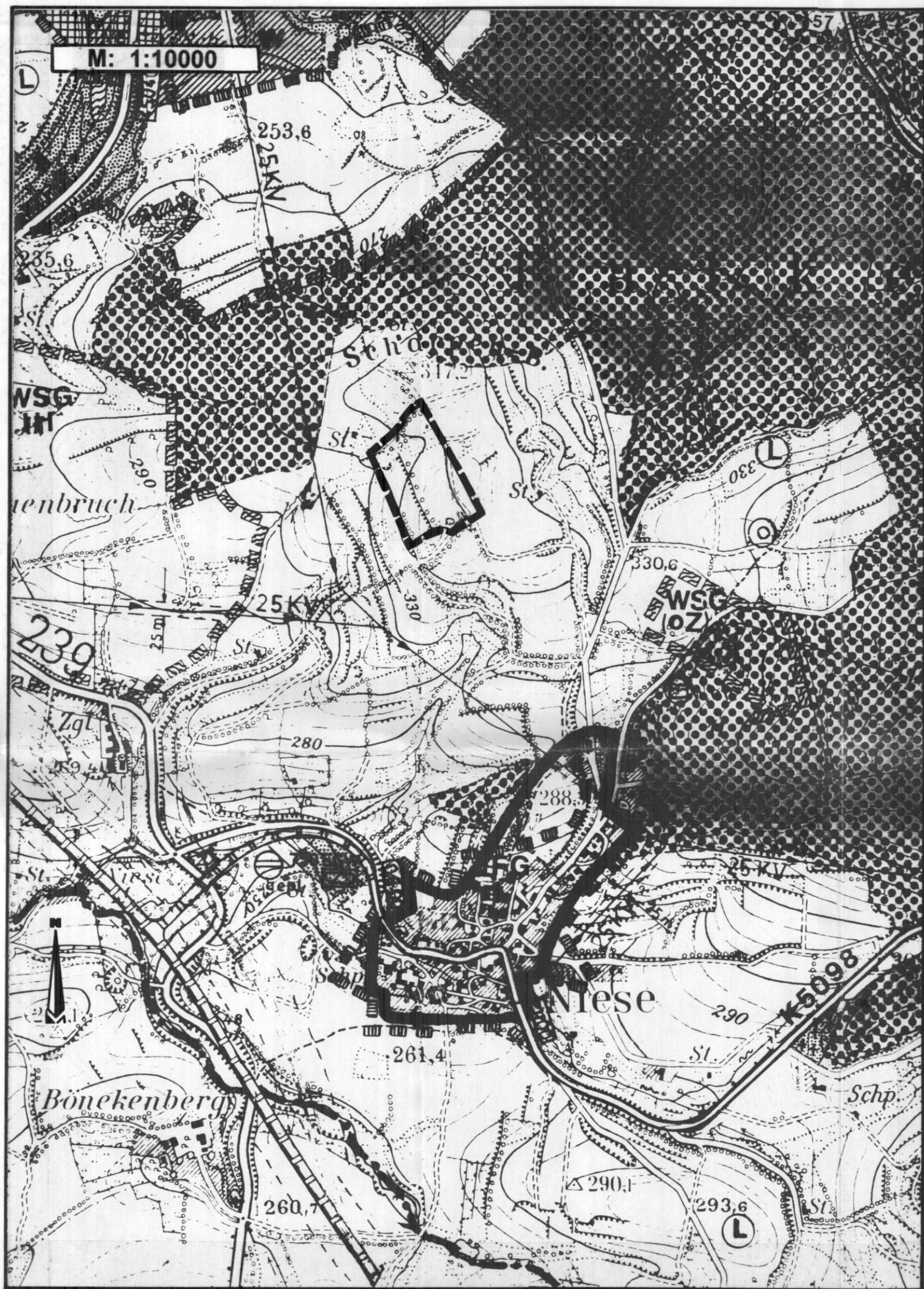
Ausschnitt aus dem Flächennutzungsplan der Stadt Lügde