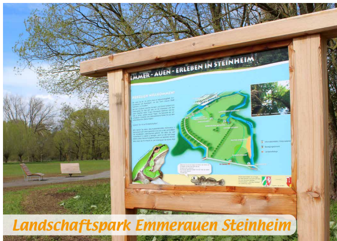
Landschaftspark Emmerauen Steinheim